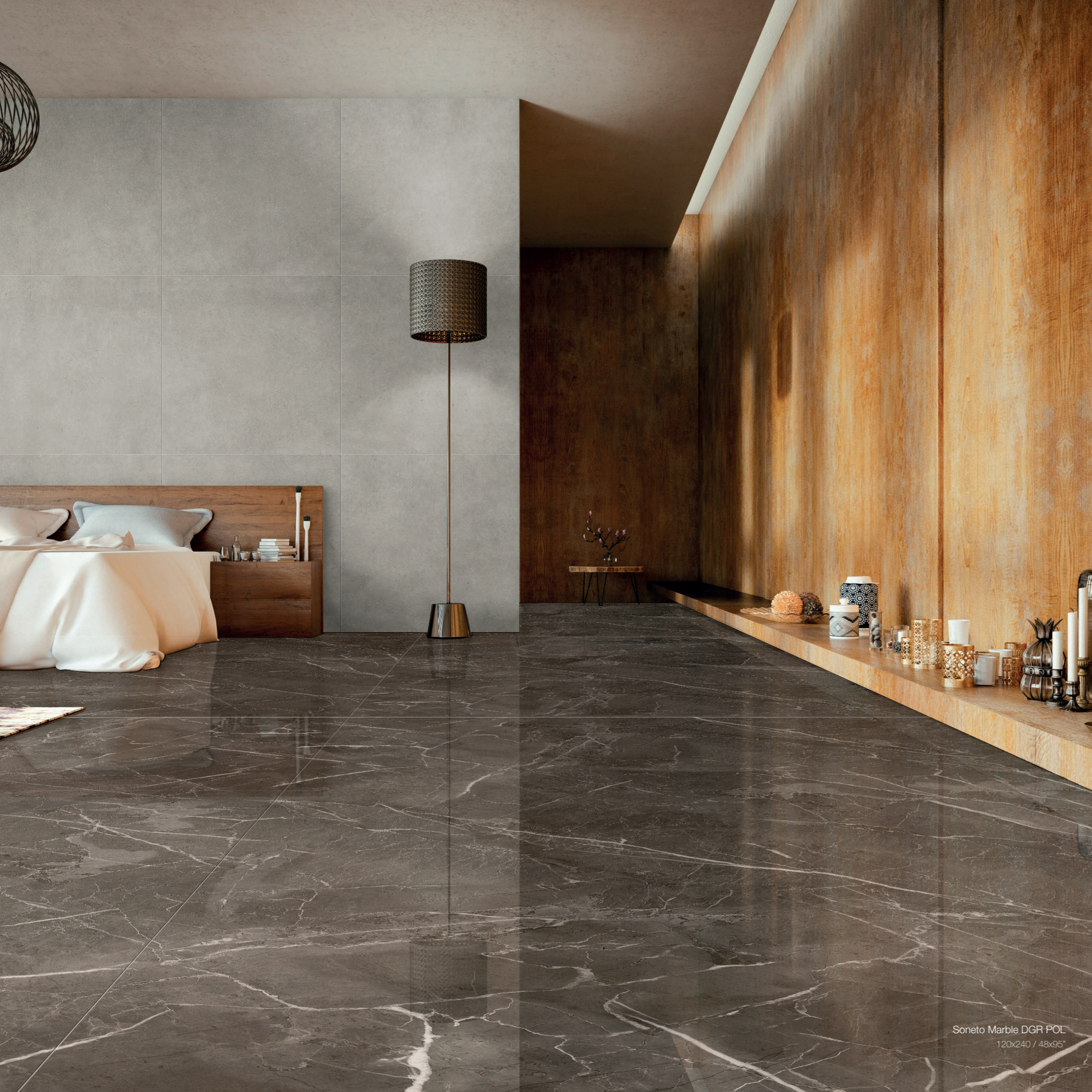
Soneto Marble DGR POL 120x240 / 48x95"