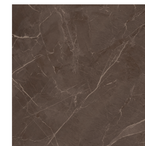
Soneto Marble DGR 120x120 / 48x48" POL RET V3 - USO 5