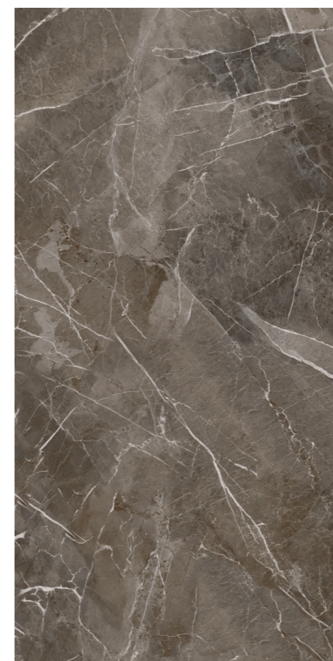
Soneto Marble DGR 120x240 / 48x95" POL RET V3 - USO 5