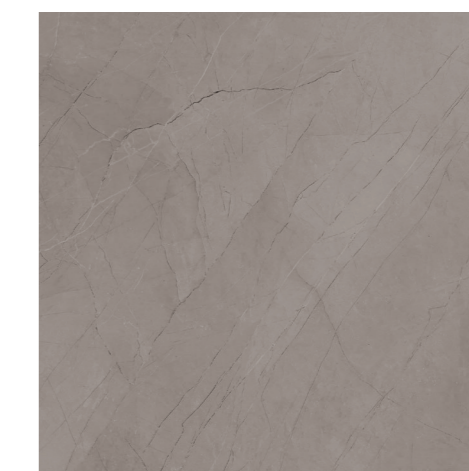
Soneto Marble GR 120x120 / 48x48" POL RET V3 - USO 5