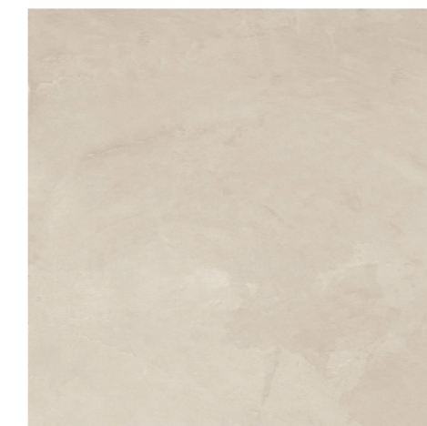
Soneto Cement AL 120x120 / 48x48" NAT RET V3 - USO 5