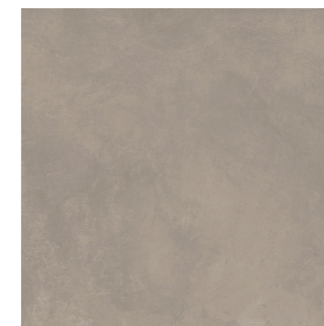
Soneto Cement GR 120x120 / 48x48" NAT RET V3 - USO 5