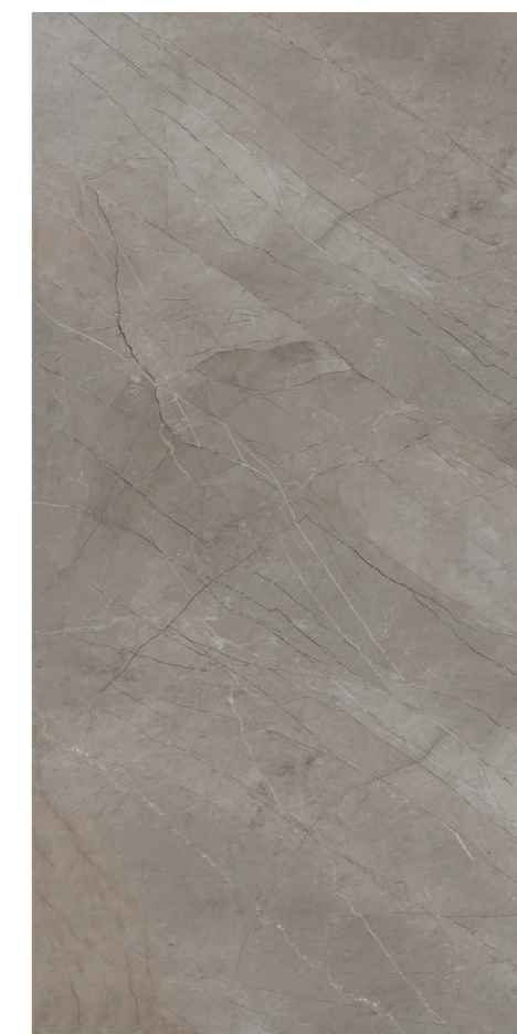
Soneto Marble GR 120x240 / 48x95" POL RET V3 - USO 5