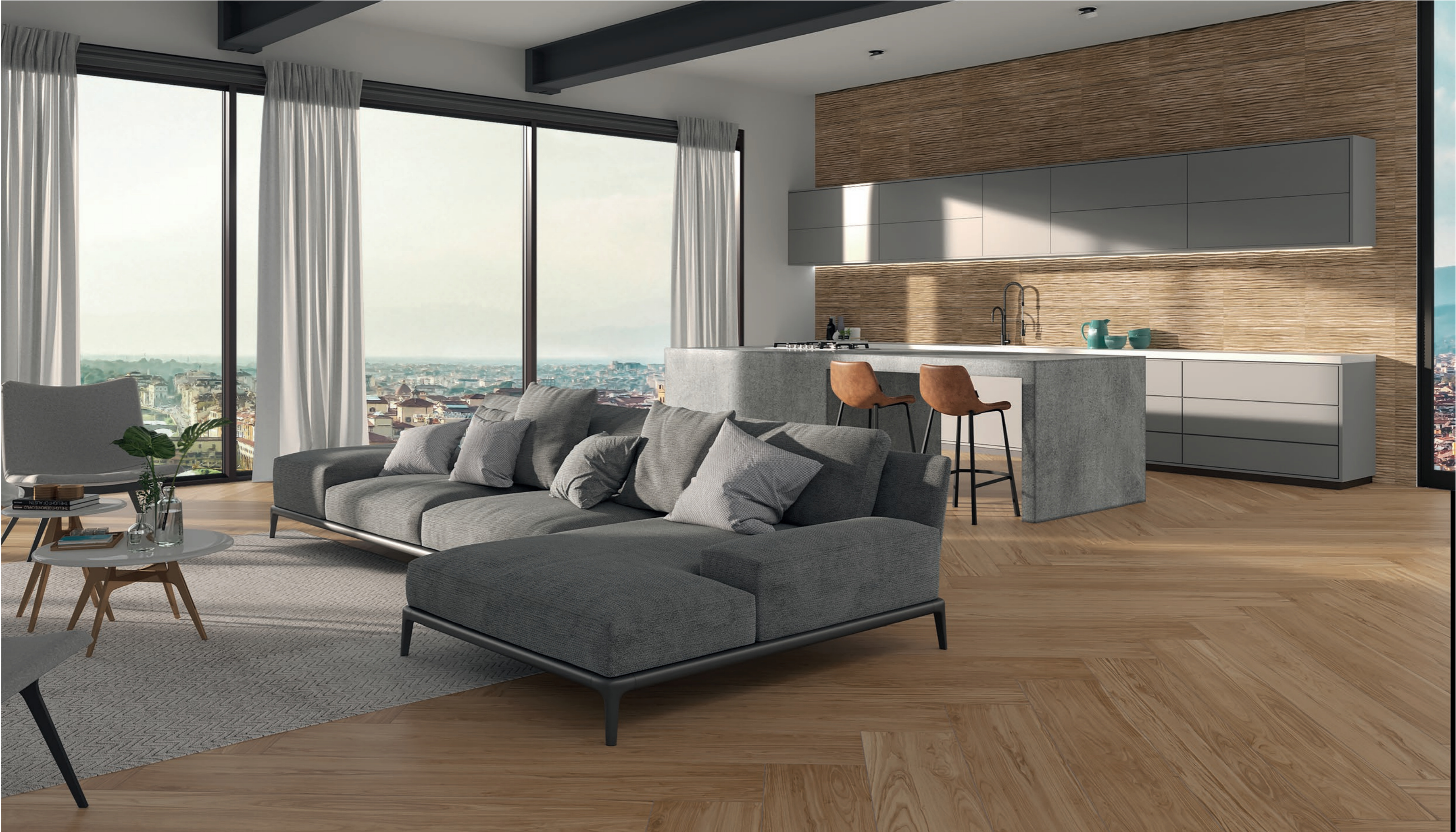
Scene Decor BW NAT 60x60 / 24x24" Scene BW NAT 26x160 / 10x63"