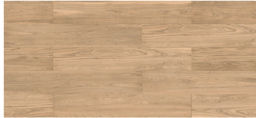
Variação visual | Shade Variation | Variación de tono Scene BE 26x160 / 10x63"