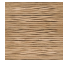
Scene Decor BW 60x60 / 24x24" MATTE RET V3 - USO 1