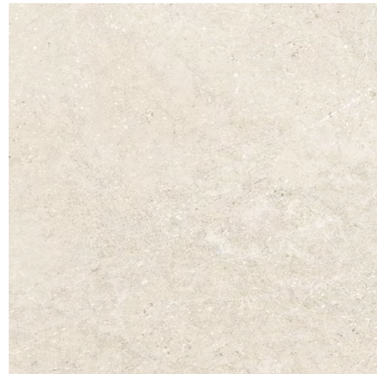
Piemonte OFW POL Piemonte OFW NAT 90x90 cm / 36x36" RET