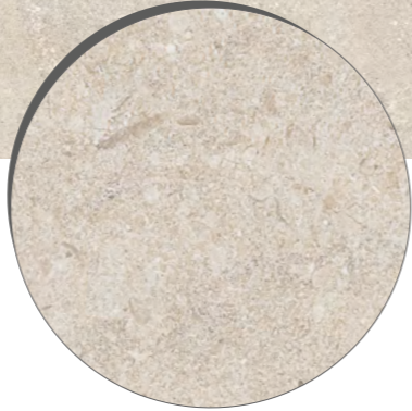
Piemonte SBE 90x90 cm / 36x36" RET