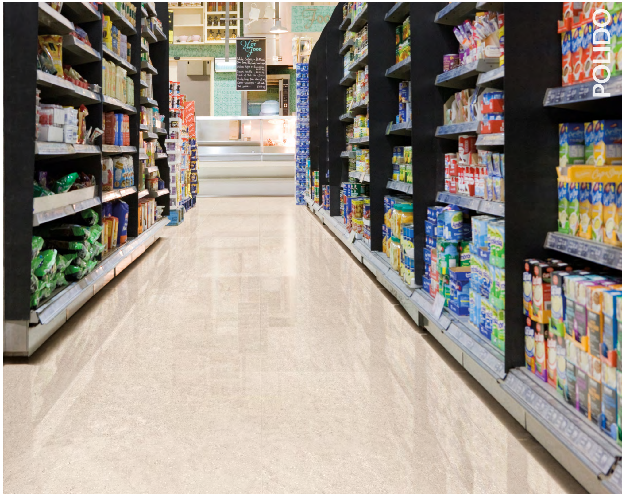
Piemonte SBE POL 90x90 cm / 36x36" RET