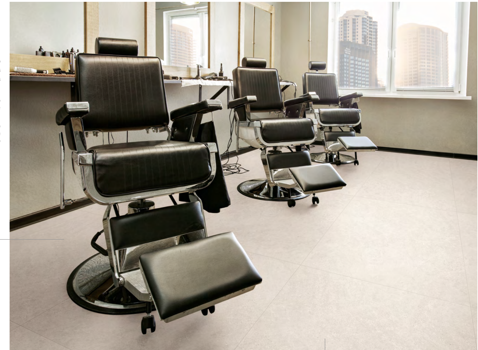
Piemonte SBE NAT 90x90 cm / 36x36" RET

INTERNO: áreas secas. Internal: dry areas. | Interno: áreas secas.