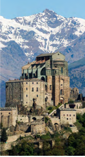
Design inspired by the natural stones of the Piedmont region, in Italy. | Diseño inspirado en las piedras naturales de la región de Piamonte, Italia.

inspirado nas pedras naturais da região de Piemonte, na Itália.