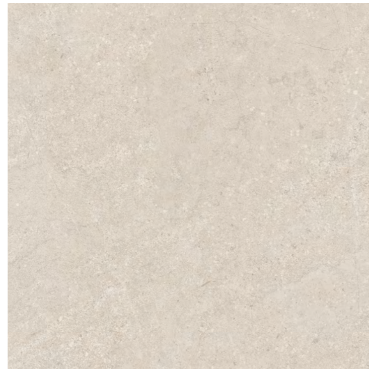
Piemonte SBE POL Piemonte SBE NAT 90x90 cm / 36x36" RET

Classe de uso. Class of use. | Classe de uso.