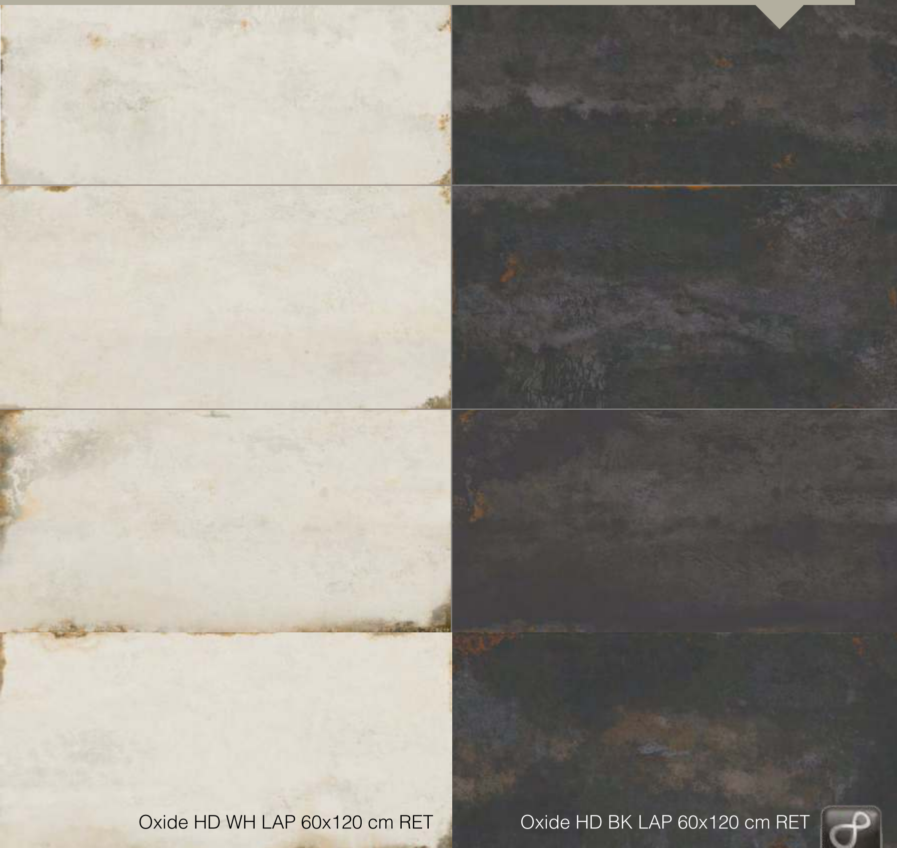
Oxide HD WH LAP 60x120 cm RET

One piece differs from the other | Una pieza diferente de la otra