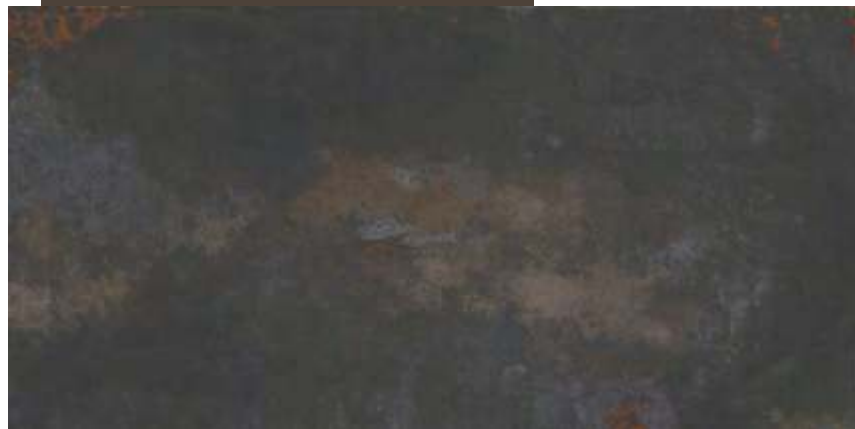
Oxide HD BK 60x120 cm / 24x47"