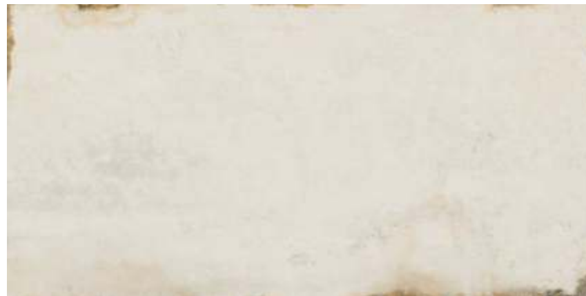
Oxide HD WH 60x120 cm / 24x47"