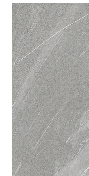
Oslo GR 60x120 / 24x48" NAT / HARD RET V3 - USO 5