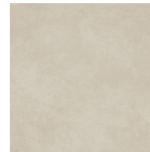
Momento SBE 100x100 / 40x40" POL - USO 5 NAT / HARD - USO 6 RET V2

La colección Momento reproduce fielmente el cemento. Con una completa paleta de colores, las piezas son para ambientes que exigen neutralidad para vivir momentos increíbles.