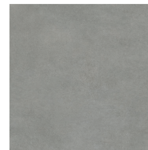
Momento DGR 100x100 / 40x40" NAT / HARD / POL RET V2 - USO 5