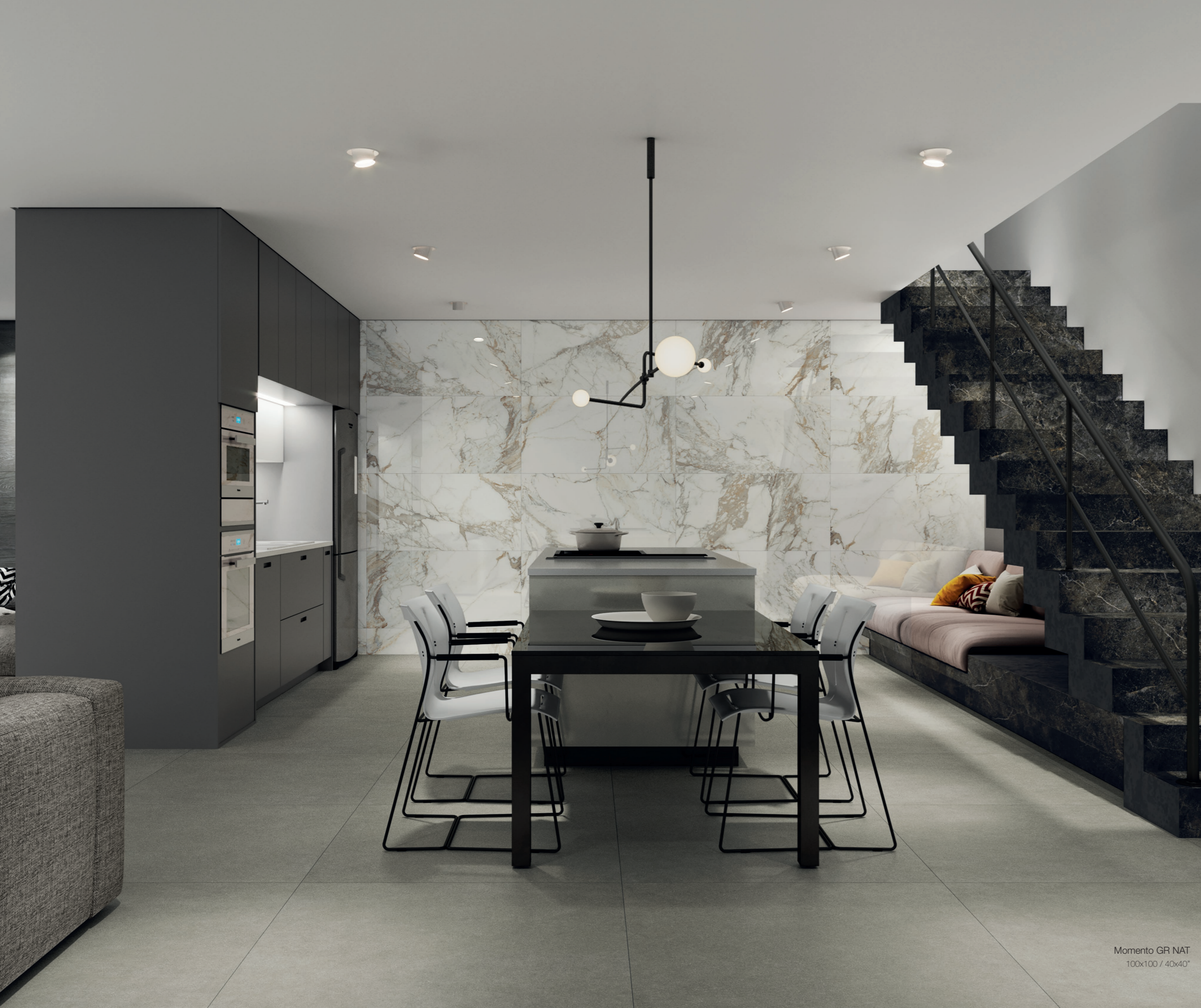
Momento GR NAT 100x100 / 40x40"

A coleção Momento reproduz fielmente o cimento. Com uma paleta de três tons, as peças são para ambientes que pedem neutralidade para viver momentos incríveis.