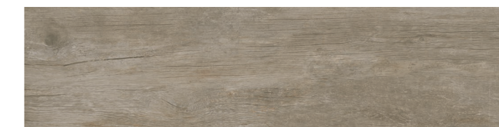
Memory GR 30x120 / 12x48" NAT / HARD RET V3 - USO 5