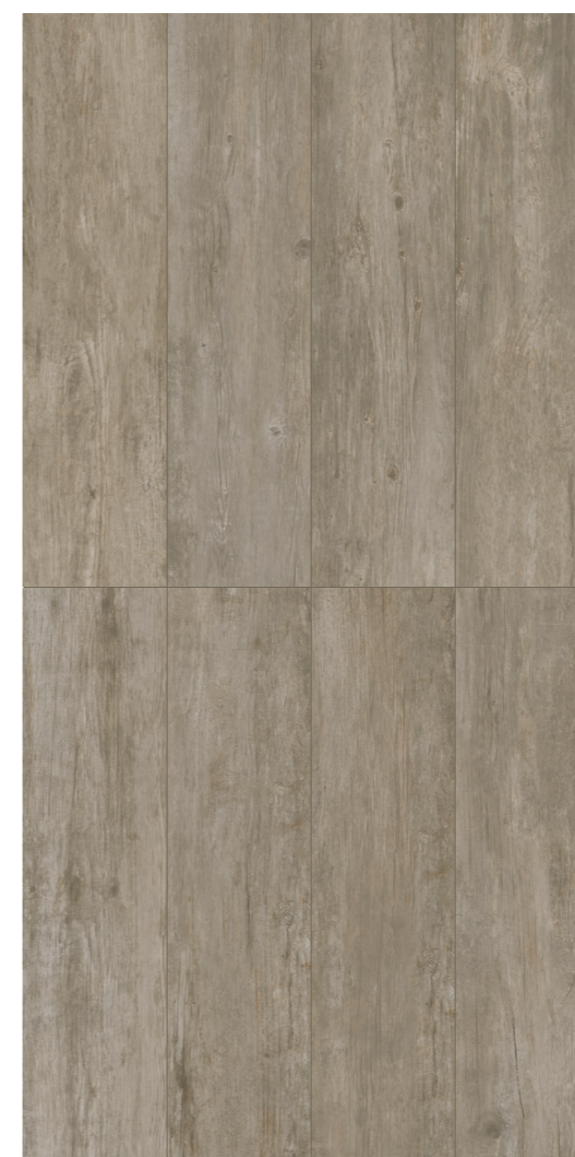
Memory GR NAT 30x120 / 12x48"

Variação visual Shade variation / Variación de tono