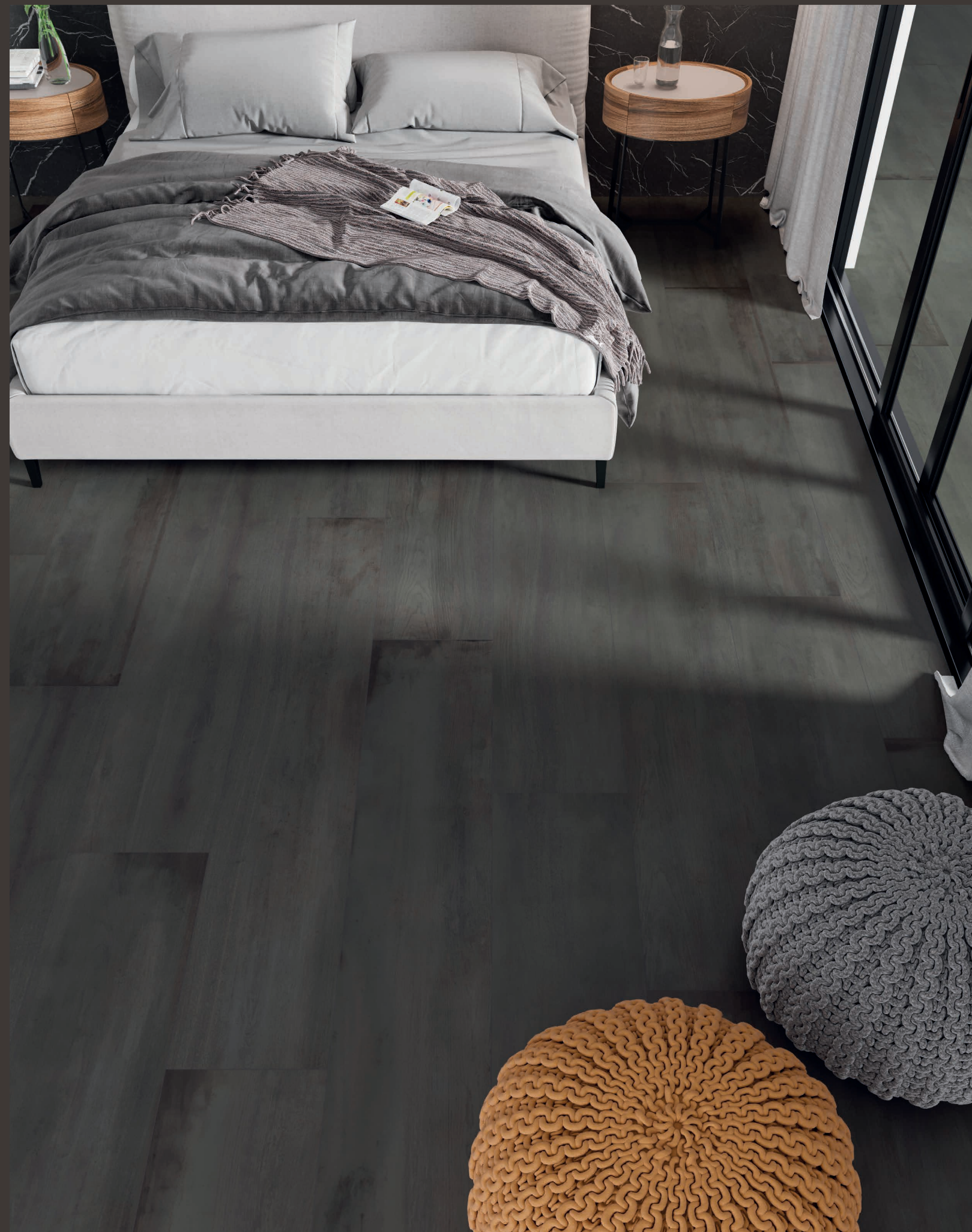
Heavy Wood DBL NAT 26x160 / 10x63"