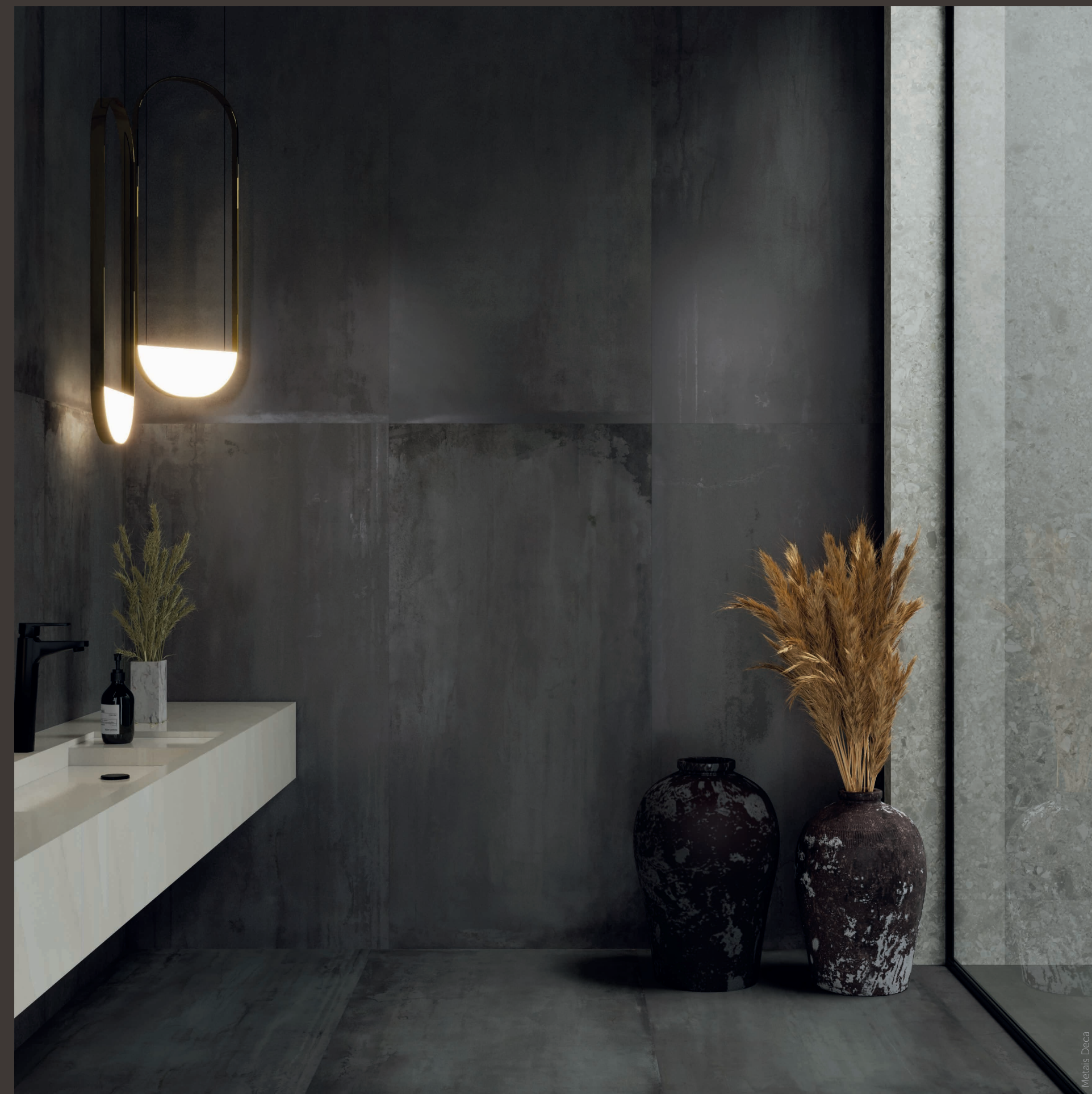
Heavy Metal DBL NAT 80x160 / 31x63"

Como su propio nombre indica: una colección de metal con un visual intenso. Heavy trae la combinación de una placa de metal a tono con la madera. En dos formatos, realza el azul oscuro, expresando poder y elegancia.