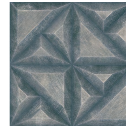
Extreme GR 60x60 cm / 24x24"