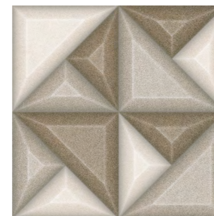
Extreme NO Mix 60x60 cm / 24x24"

Las formas urbanas de la Colección Extreme son una invitación a explorar la volumetría de las piezas. Con el movimiento de los relieves tridimensionales, grandes paneles y fachadas increíbles pueden ser creados con iluminación diferenciada. La inspiración en bloques de hormigón ganó nueva apariencia en colores del cemento tradicional, grafito moderno y un mix de tonos cálidos en la misma pieza. Al montar un panel, el encuentro de los relieves da la impresión de ser una pieza única. Para formar diferentes paginaciones, solo rotar el producto.