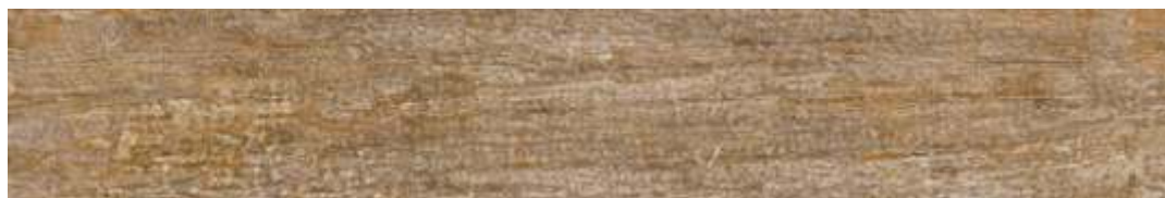
Pátina HD NO 20x120 cm / 8x47"