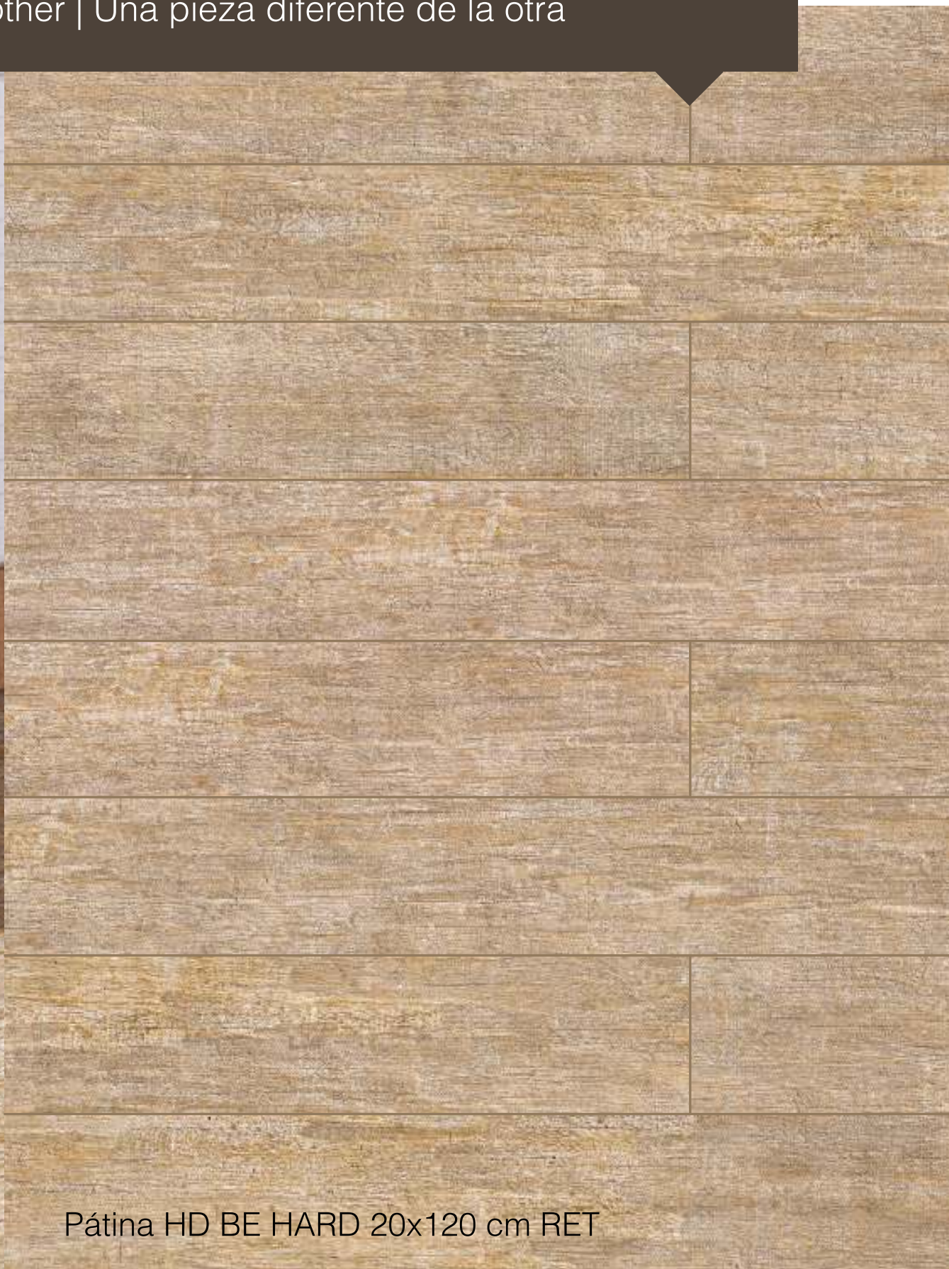
Pátina HD BE HARD 20x120 cm RET

Nestes produtos você vai encontrar uma peça diferente da outra. Isso confere naturalidade aos ambientes. Confira na próxima página a orientação de assentamento para produtos com variação visual.