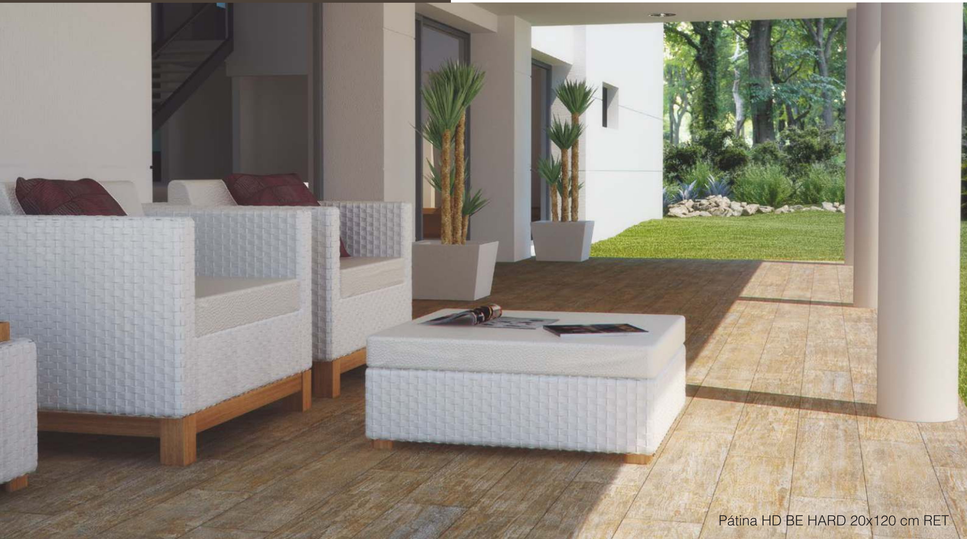
Pátina HD BE HARD 20x120 cm RET

Originalmente, pátina era um termo que definia a película de coloração esverdeada que aparece no bronze ou no cobre devido à oxidação pela ação do tempo. Depois, aquele aspecto acetinado com variação de tonalidade que a madeira adquire com o desgaste natural ou pela exposição à luz, foi igualmente denominado pátina. Hoje em dia, esse efeito passou a ser aplicado, propositalmente, com técnicas de pintura. A Cerâmica Portinari se inspirou na pátina provençal para criar o Eco Patina HD.