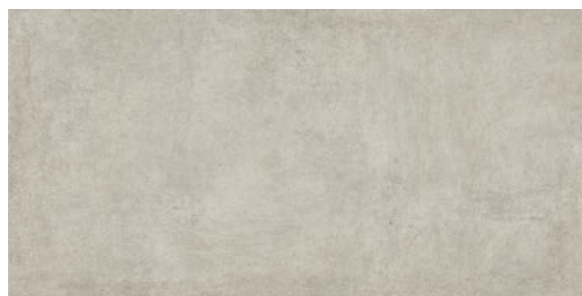
Detroit AL 60x120 cm / 24x48"

POL RET - USO 5 ACT RET - USO 6 MAT HARD RET - USO 6 V2