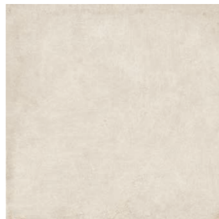
Detroit OFW 90x90 cm / 36x36"

POL RET - USO 5 ACT RET - USO 6 MAT HARD RET - USO 6 V2