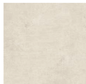
Detroit OFW 60x60 cm / 24x24"