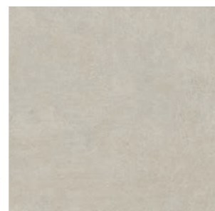
Detroit AL 60x60 cm / 24x24"