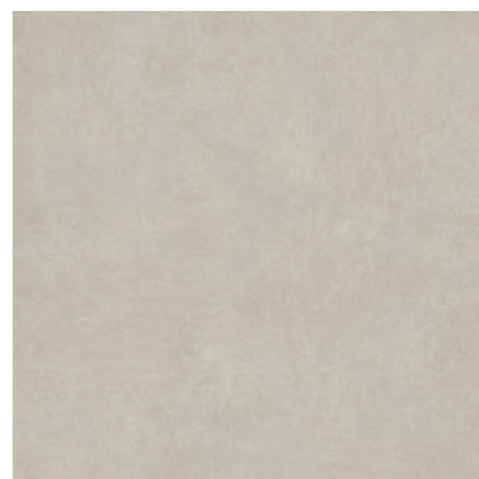
Detroit AL 90x90 cm / 36x36"