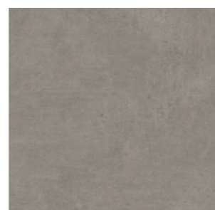
Detroit NO 60x60 cm / 24x24"