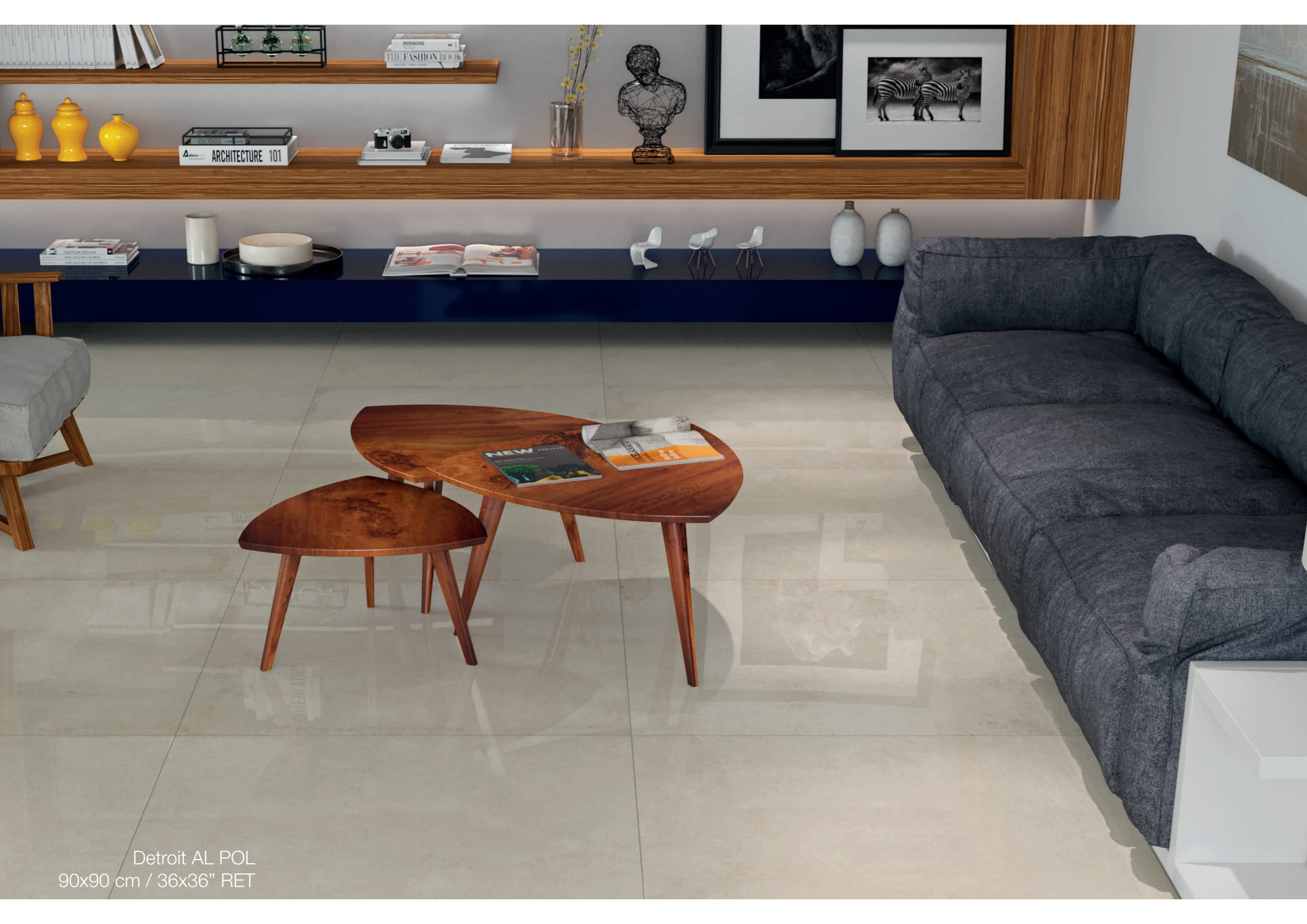
Detroit AL POL 90x90 cm / 36x36" RET