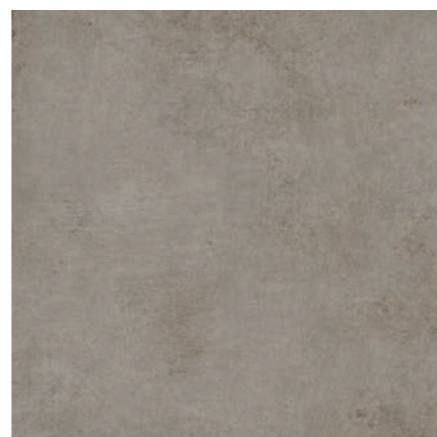
Detroit NO 90x90 cm / 36x36"