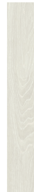
Chaplin WH 20x120 / 8x48" NAT RET V3 - USO 5