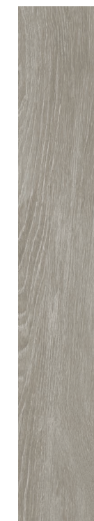
Chaplin GR 20x120 / 8x48" NAT RET V3 - USO 5