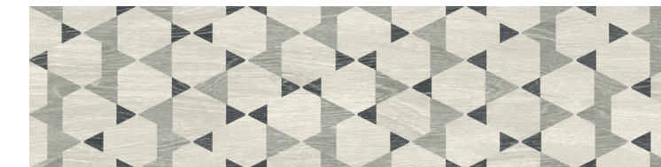
Chaplin Decor Mix 30x120 / 12x48" NAT RET V3 - USO 1