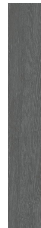
Chaplin DGR 20x120 / 8x48" NAT RET V3 - USO 5