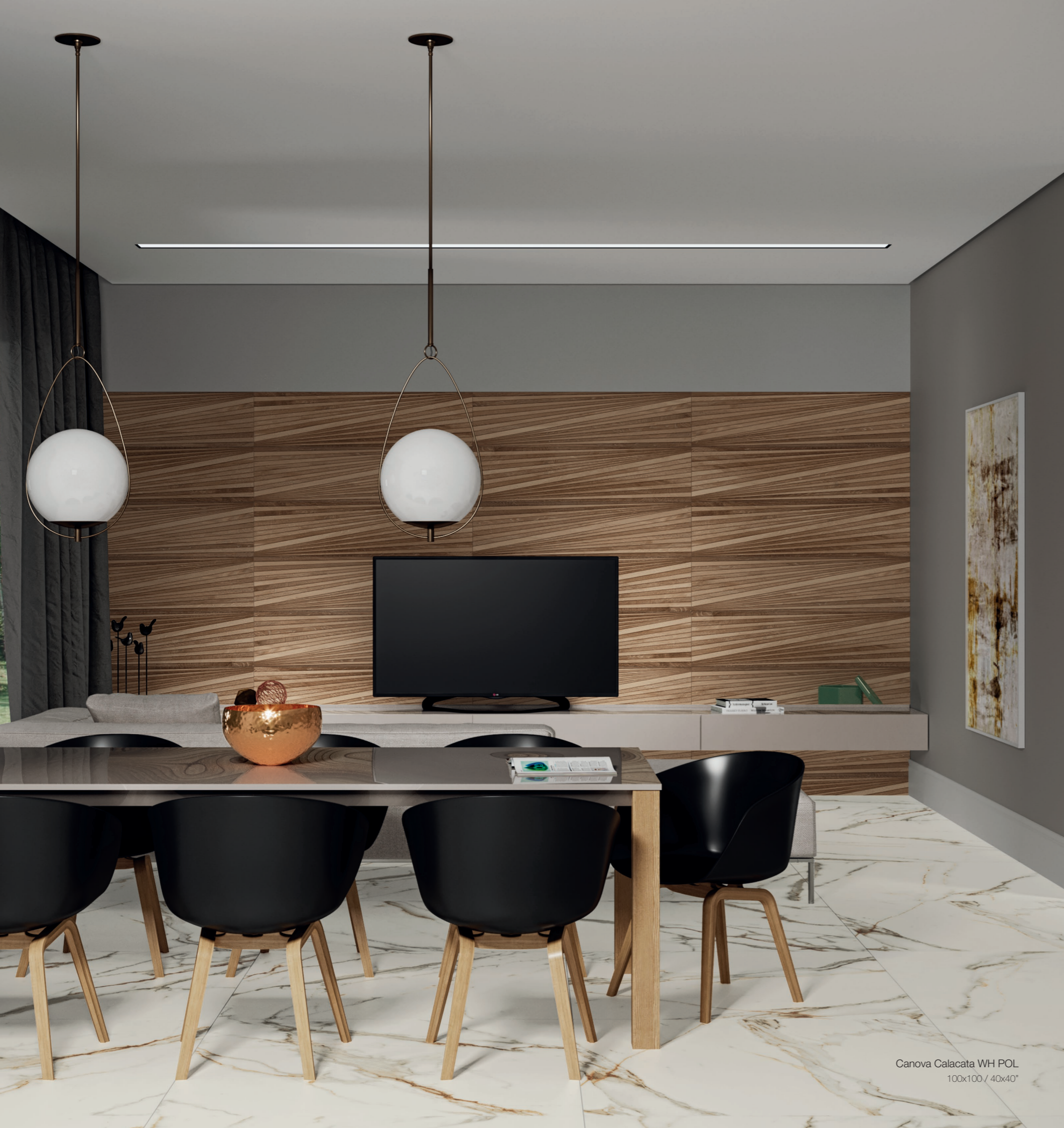
Canova Calacata WH POL 100x100 / 40x40"

O clássico mármore Calacata Machiavechia, ganhou reprodução no porcelanato. Antonio Canova, escultor italiano, utilizou as pedras naturais para modelar suas esculturas. As obras de Canova foram comparadas por seus contemporâneos como a melhor produção da antiguidade. A coleção Canova com veios dourados marcantes, além de bela, carrega consigo anos de história.