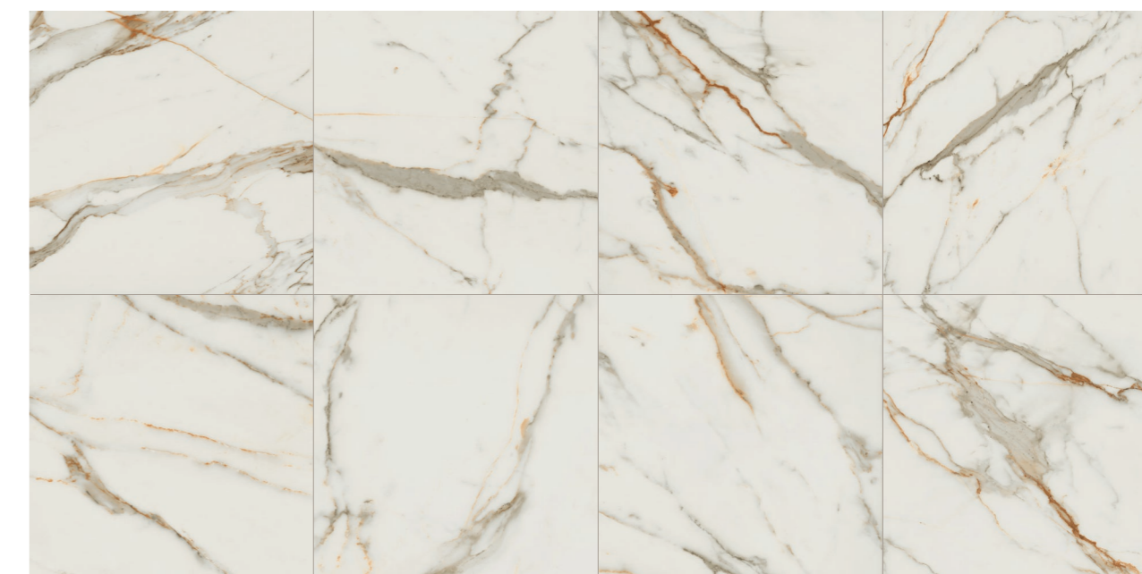
Canova Calacata WH POL 100x100 / 40x40"

Variação visual Shade variation | Variación de tono