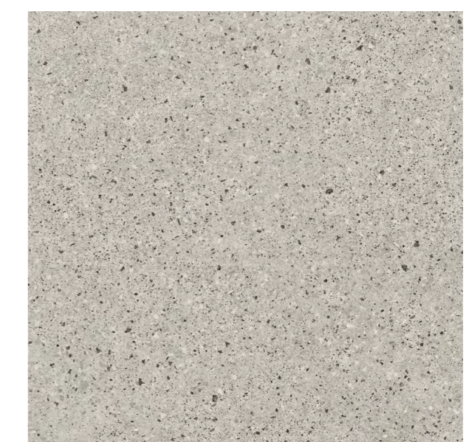
Battuto SGR 100x100 cm / 40x40"