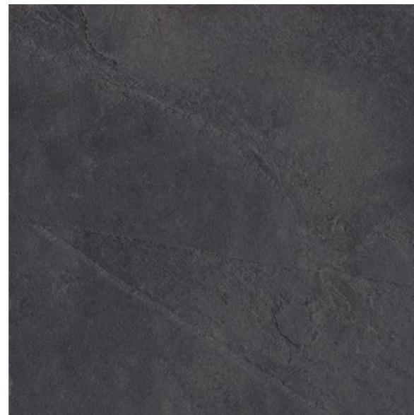
Artois DGR 90x90 cm / 36x36"