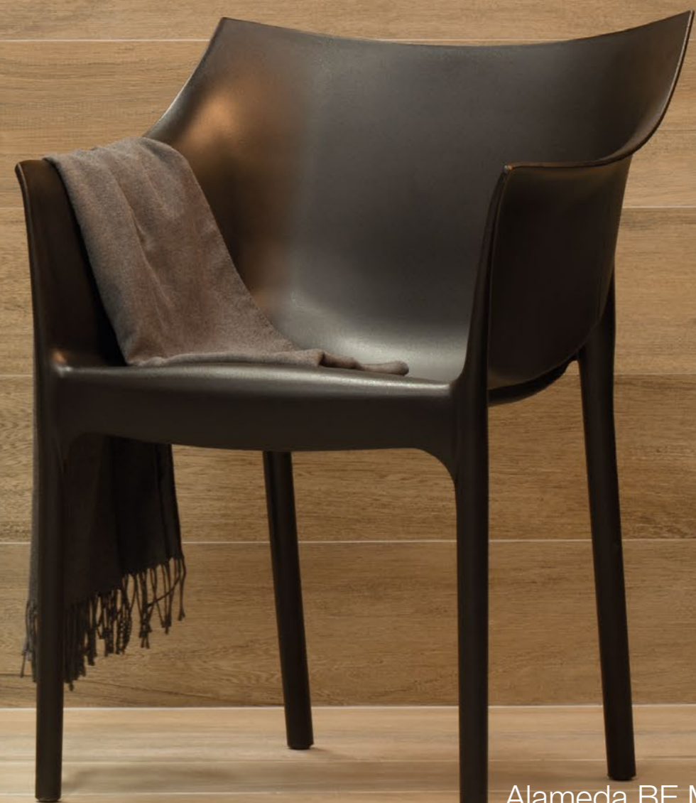
Alameda BE MAT 20x120 cm / 8x48" RET