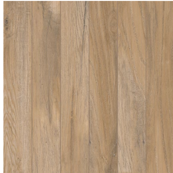
MAT HARD BOLD USO 5 V3

Cores e formatos Colors and sizes | Colores y formatos