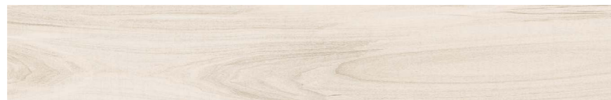
Abitare HD WH 20x120 cm / 8x48"

Cores e formatos Colors and sizes | Colores y formatos