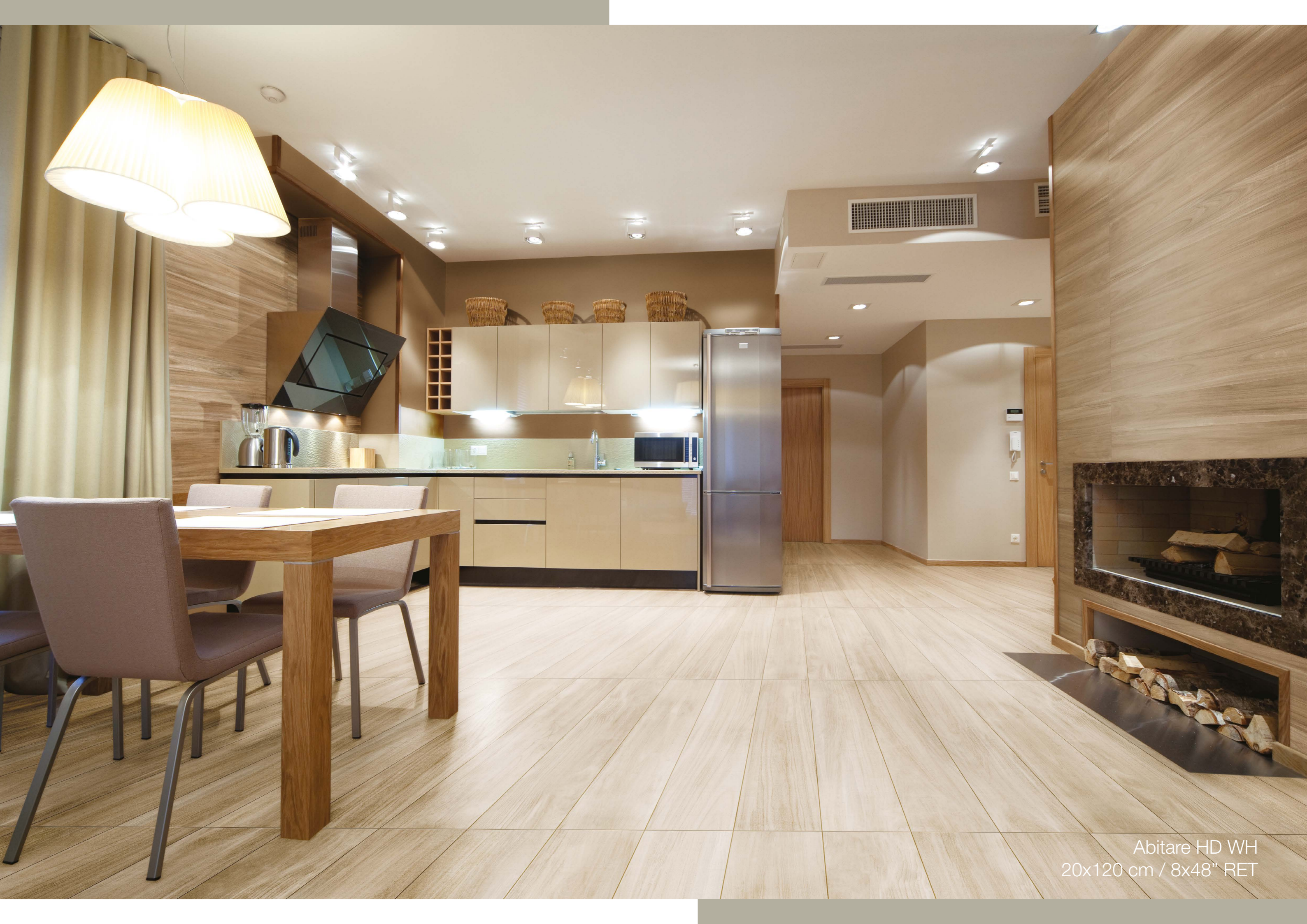
Abitare HD WH 20x120 cm / 8x48" RET