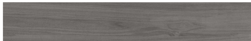
Abitare HD DGR 20x120 cm / 8x48"