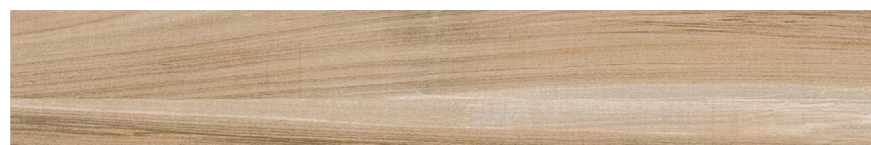
Abitare HD BE 20x120 cm / 8x48"